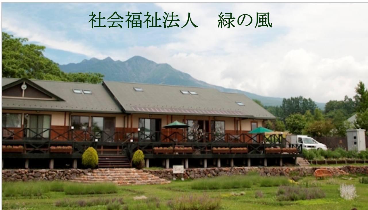
障害者就労支援事業 さくらベーカリー

社会福祉法人緑の風は、知的障害のある人達が 「地域で自分らしく暮らし、地域で働くこと」の 支援を行うために活動をしています